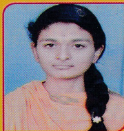
INDU B EC-IISEM 92.5%