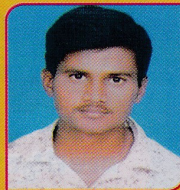
MAIBU BHASHA ME-IVSEM 91.17%