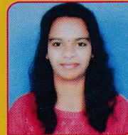
CHAMUNDESHWARI CS-IISEM 80.5%