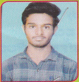
G ANANDA JSW STEELS LTD TORANAGAL