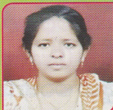
ASHA J V JE (Civil) RD & PR, RDWS, Ballari.